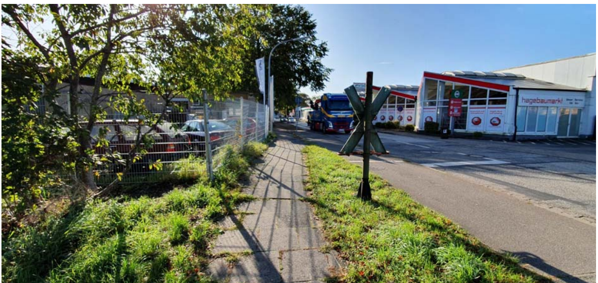
Bild 6 BÜ Friedrichstädter Straße, Blickrichtung Süden