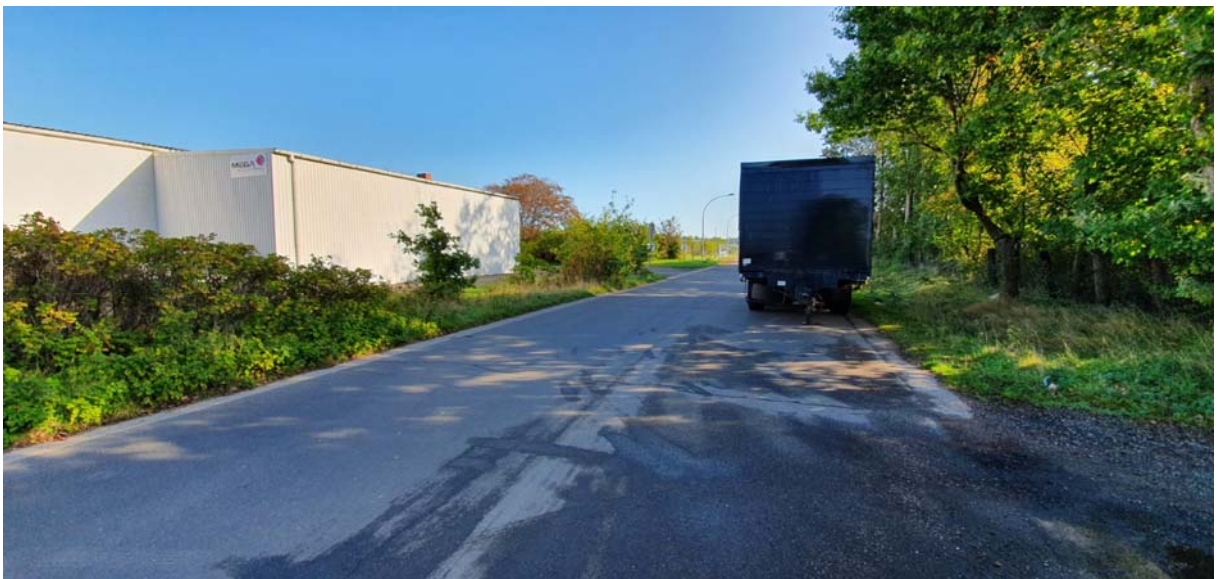
Bild 2 Zufahrt Oktogon / Loher Straße, Blickrichtung Nordosten