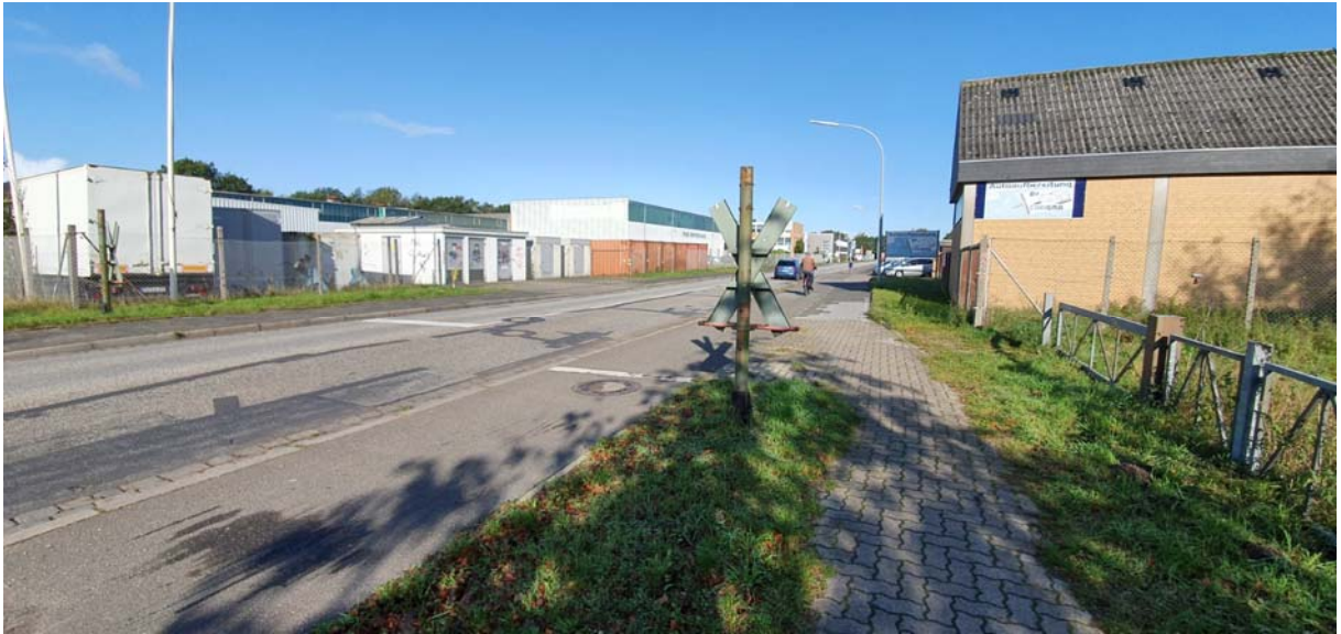
Bild 5 BÜ Friedrichstädter Straße, Blickrichtung Nordwesten