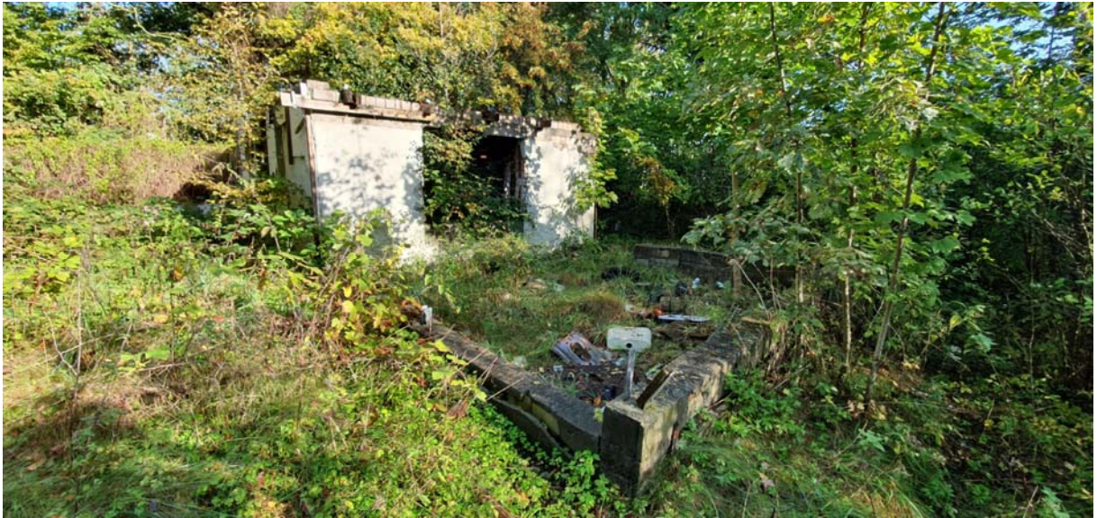
Bild 3 exemplarische Reste aus ehemaliger Kleingartensiedlung