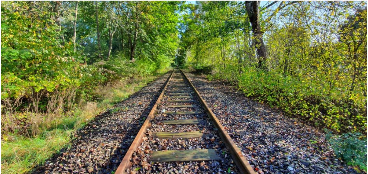
Bild 7 Streckengleis 1012 „Rendsburg-Husum“ Bereich künftige Zufahrtsweiche, Blickrichtung Nordosten