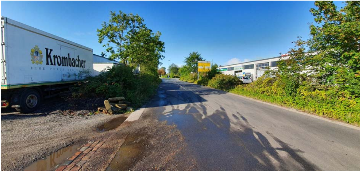
Bild 1: Zufahrt Kreisverkehr Loher Straße / Friedrichstädter Straße, Blickrichtung Südwesten