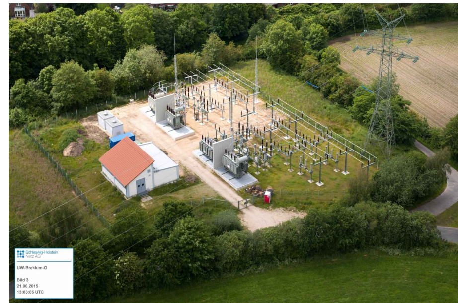
Schleswig-Holstein Netz AG UW-Breklum-O Blatt 3 21.06.2015 13:03:05 UTC