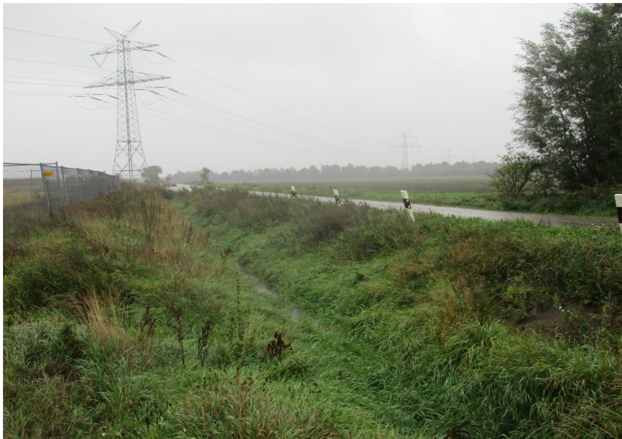
Bild 2: Einleitstelle; Verbandsgewässer: 24; Blickrichtung: Ost (neuerlegter Graben)