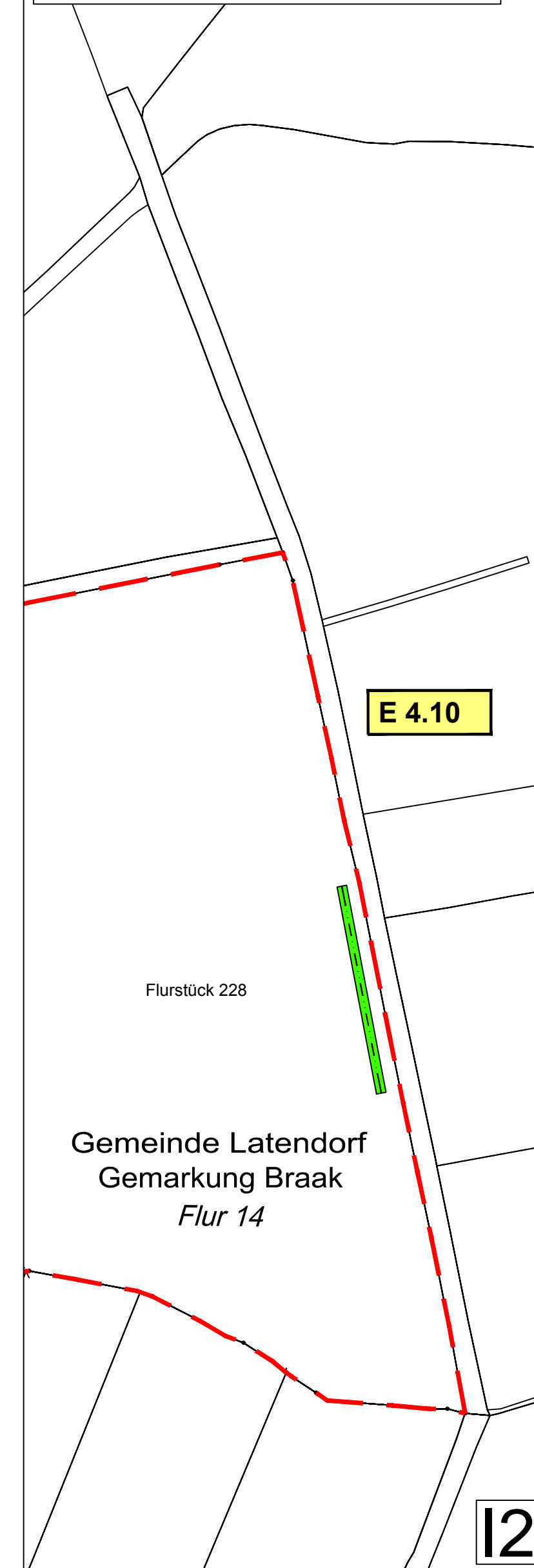
Knickökokonto Schmalfeld 4 - Schmalfeld (Ausschnitt 2) M: 1: 2.500 Flur: 14