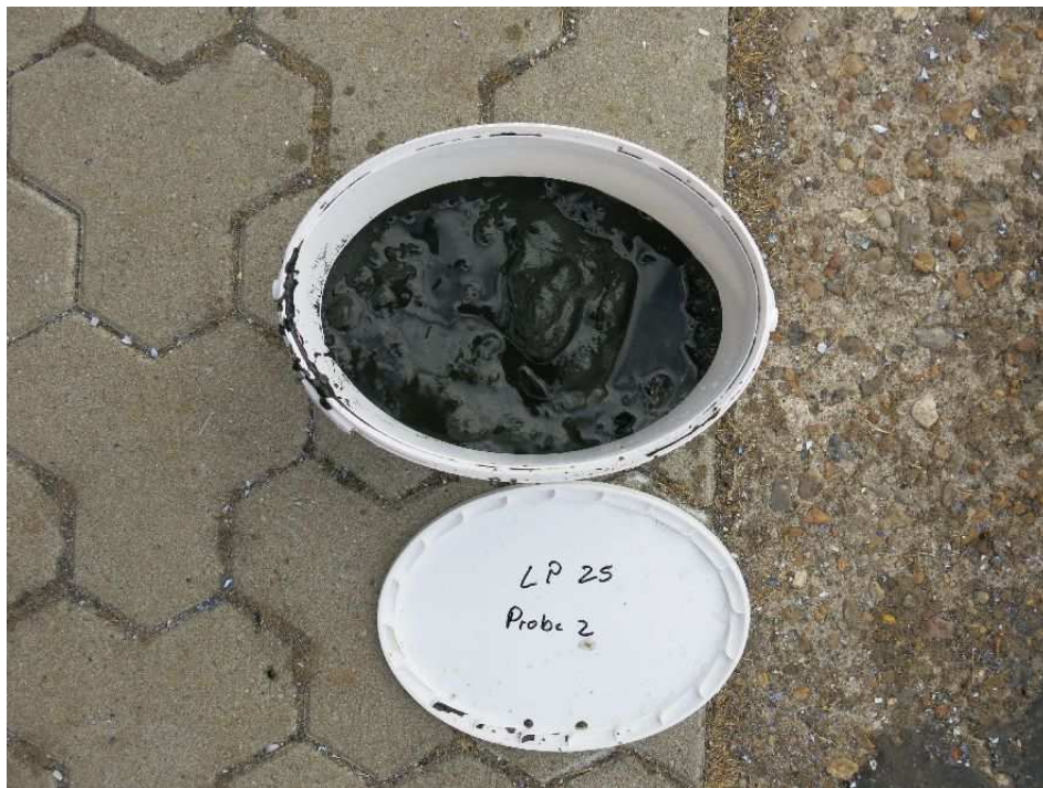
Foto Nr. 4 Probe Nr. 2