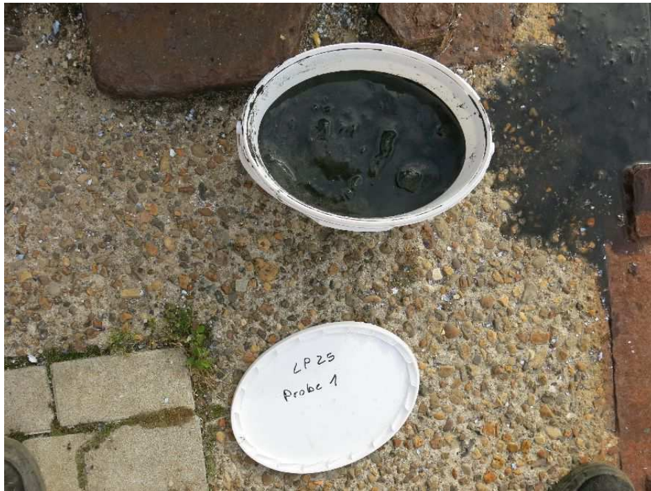
Foto Nr. 2 Probe Nr. 1