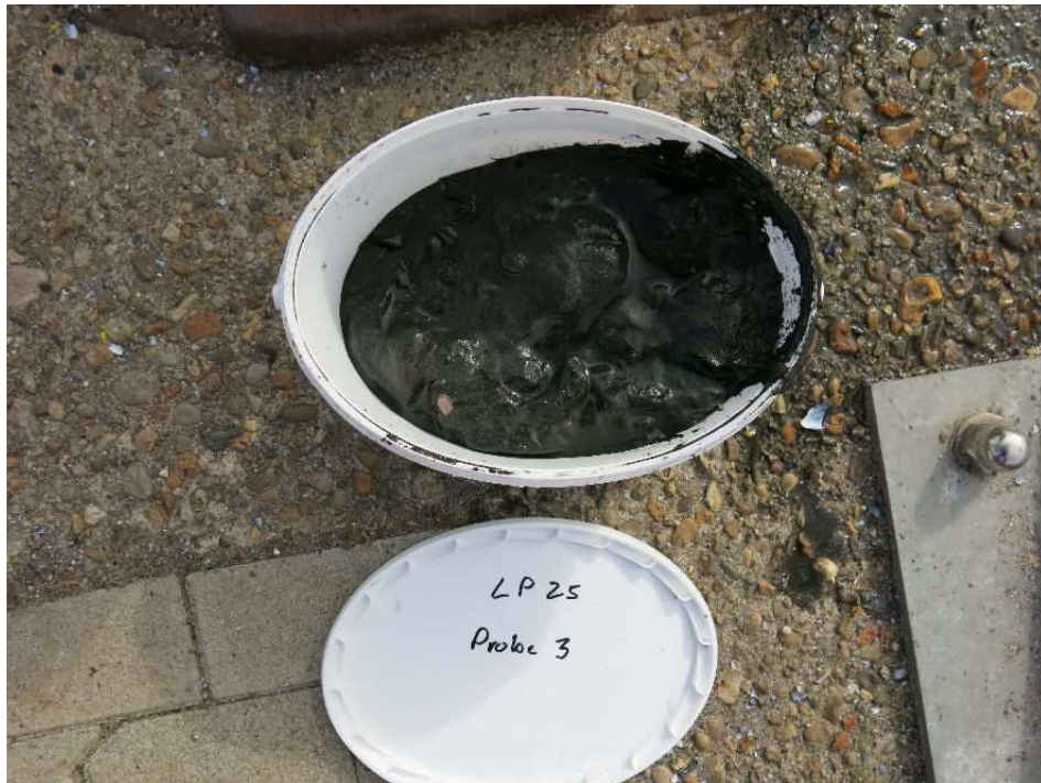
Foto Nr. 6 Probe Nr. 3